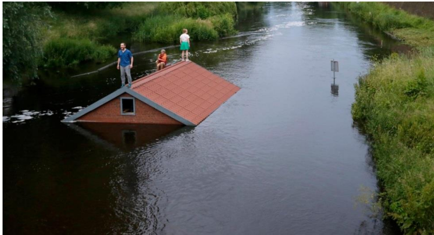
Jonge Makers Route – Karavaan Festival

Donaties van meer dan € 5.000 werden gedaan aan het Nederlands Film Festival, Cello Biennale Amsterdam, Junior Grachtenfestival Amsterdam, Tweetakt Festival, Jonge Harten Festival, Karavaan Festival, Over het IJ Festival, Moving Futures Festival, Festival Cement en Café Theater Festival.