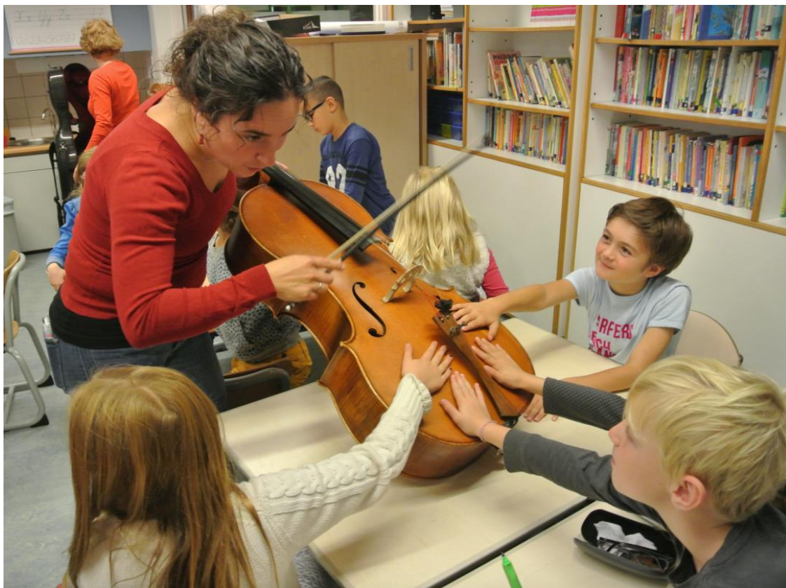
De Bestorming - educatieprogramma Cello Biënnale Amsterdam

De medewerkers van het bureau ontvangen voor hun werkzaamheden een marktconform salaris.