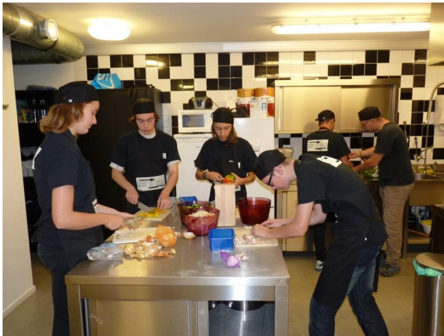
The Colour Kitchen - jongeren met een afstand tot de arbeidsmarkt

In alle gevallen worden de donaties op aanvraag verstrekt.