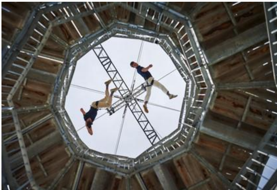
Funnel Vision – Seraphim Richter (Snelloket)

Sommige van deze donaties werden verstrekt in het kader van een samenwerkingsprogramma van fondsen rond armoede, een samenwerkingsprogramma tegen adverse childhood experiences en een samenwerkingsprogramma tegen kindermisbruik.