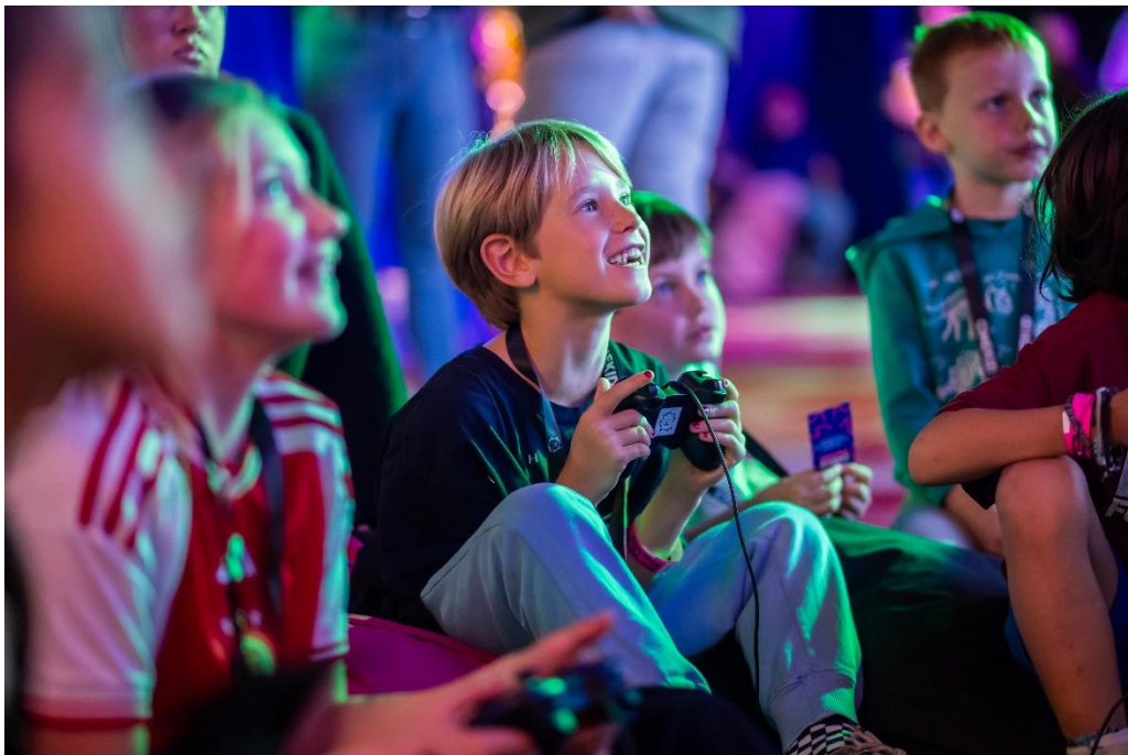
Cinekid/Momenttom – Masterclass Acteren

Het beeld van 2021 werd overigens sterk beïnvloed door de eerste toewijzingen via het Snelloket Jonge Makers. In dat pilotjaar werden de Snelloket-donaties om administratieve redenen nog niet apart geteld maar als één donatie meegenomen. Gecorrigeerd voor dat effect was de gemiddelde donatie in 2021 € 7.792 en dat lag veel meer in lijn met het gemiddelde in eerdere jaren. Snelloket-donaties kennen een maximum van € 4.000 per aanvraag.