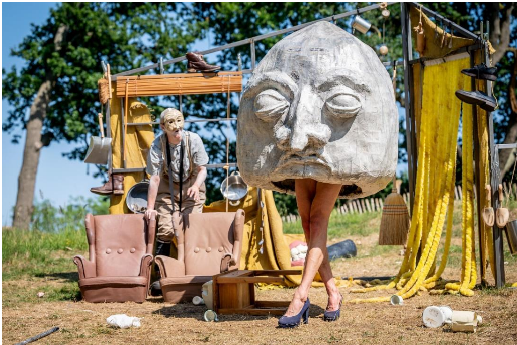
Non Creators Company

In totaal werd in de categorie Kunst een bedrag van € 409.700 (2024: € 394.000, 2023: € 357.950, 2022: € 332.000, 2021: € 301.000, 2020: € 292.500, 2019: € 315.600) aan donaties toegekend aan 97 projecten: een gemiddelde donatie dus van € 4.224, hoger dan in 2024 (€ 3.648), 2023 (€ 3.891) en 2022 (€ 3.860), fors lager dan de € 5.901 uit 2021 (wat logisch is omdat alle 23 Snelloket-donaties toen als één donatie zijn geadministreerd) en ook fors lager dan eerdere jaren (2020: € 4.570, 2019: € 5.009). Dit hangt grotendeels samen met de introductie van het Snelloket in 2021, waar de maximale donatie € 4.000 is.