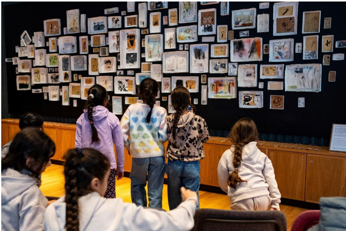
De Vrolijkheid – Van Gogh 200

Hoewel de Janivo Stichting formeel nooit meerjarige donaties verstrekt, en in beginsel ook niet langer dan drie jaar achtereenvolgende dezelfde organisatie ondersteunt, wordt in de praktijk regelmatig diverse jaren achtereenvolgende een donatie toegekend aan dezelfde organisatie, al dan niet voor eenzelfde meerjarig programma. Dat hangt dan samen met de onderscheidende positie die de betreffende organisaties innemen in het maatschappelijke of culturele domein. Een donatie is echter nooit een automatisme: jaarlijks wordt elke aanvraag van elke organisatie opnieuw op zijn merites beoordeeld.