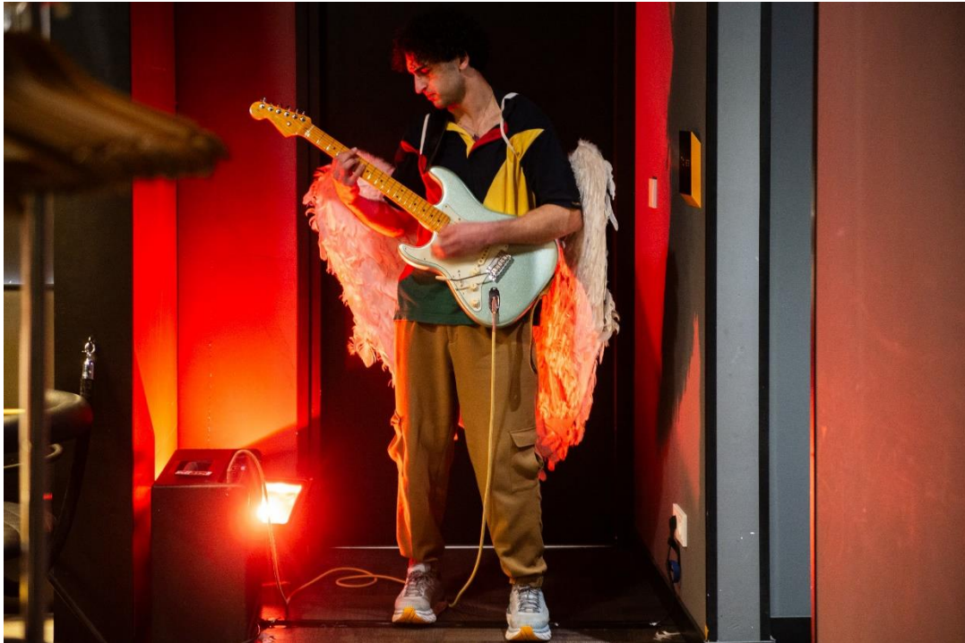
Nur en Storm

Het bestuur wenst zich te conformeren aan het sectorbeleid ten aanzien van professionaliteit, transparantie en good governance . Daartoe laat de stichting haar naleving van de FIN-code voor Goed Bestuur periodiek toetsen door een onafhankelijke auditor, voor het eerst in 2019. In 2020, 2021 en 2022 gaf het bestuur de vereiste tussentijdse compliance-verklaring af. In 2023 is weer een volledige periodieke toetsing uitgevoerd. Die toetsing werd met goed gevolg afgerond, met een positieve aantekening over de kwaliteit van het jaarlijkse bestuursverslag. In 2024 en 2025 werd vervolgens weer een reguliere compliance-verklaring afgegeven.